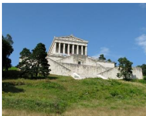
Walhalla bei Donaustauf