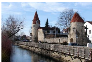
Abensberger Wahrzeichen Maderturm

..... liegt an der Abens, einem rechten Nebenfluss der Donau etwa acht Kilometer vor der Mündung. Das Gebiet um Abensberg wird gekennzeichnet durch das enge Donautal bei Weltenburg, das Altmühltal im Norden und das bekannte Hopfen-Anbaugebiet Hallertau im Süden.