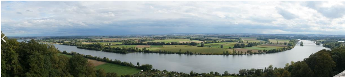
Panoramablick auf das Donauufer bei Donaustauf

..... nimmt mit der Burgruine Donaustauf in der Donaulandschaft eine markante Stellung ein. Wahrzeichen sind die Walhalla, die Burgruine sowie der Chinesische Turm.