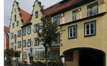
Brauereigasthof Kuchlbauer Der Weißbierspezialist aus Abensberg